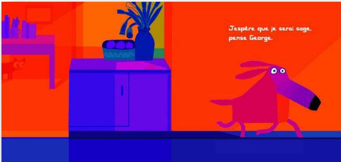
Oh non, George ! , de Chris Haughton © Thierry Magnier

Cet auteur-illustrateur a su charmer les petits comme les grands avec ces albums très graphiques aux couleurs vives et à l'humour décalé. Derrière des illustrations simples, on découvre une réelle réflexion et un travail très minutieux (un petit écureuil se cache, par exemple, dans chacun de ses albums !) qui concourt à créer un univers drôle et loufoque immédiatement reconnaissable.