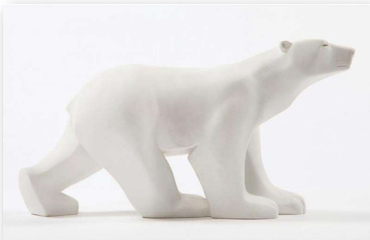
Ours Blanc, François Pompon © Musée d'Orsay

Nombre et durée des séances : 1 à 2 séances, 45 min à 1h