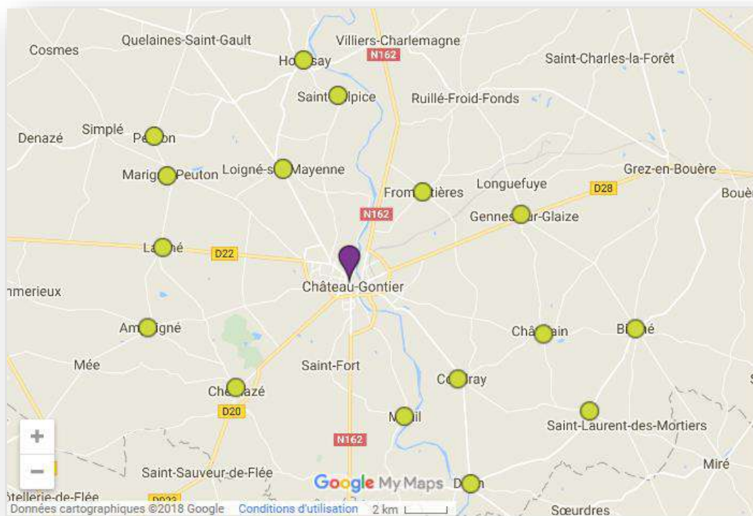
Carte des bibliothèques du réseau © Service Communication – CCPCG