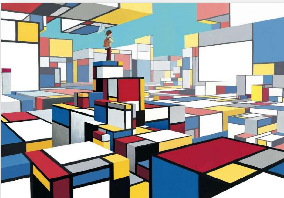
L'Ange disparu , de Max Ducos © Editions Sarbacane

En faisant observer attentivement les illustrations par les enfants, cet accueil ouvre une porte vers le monde de l'art.