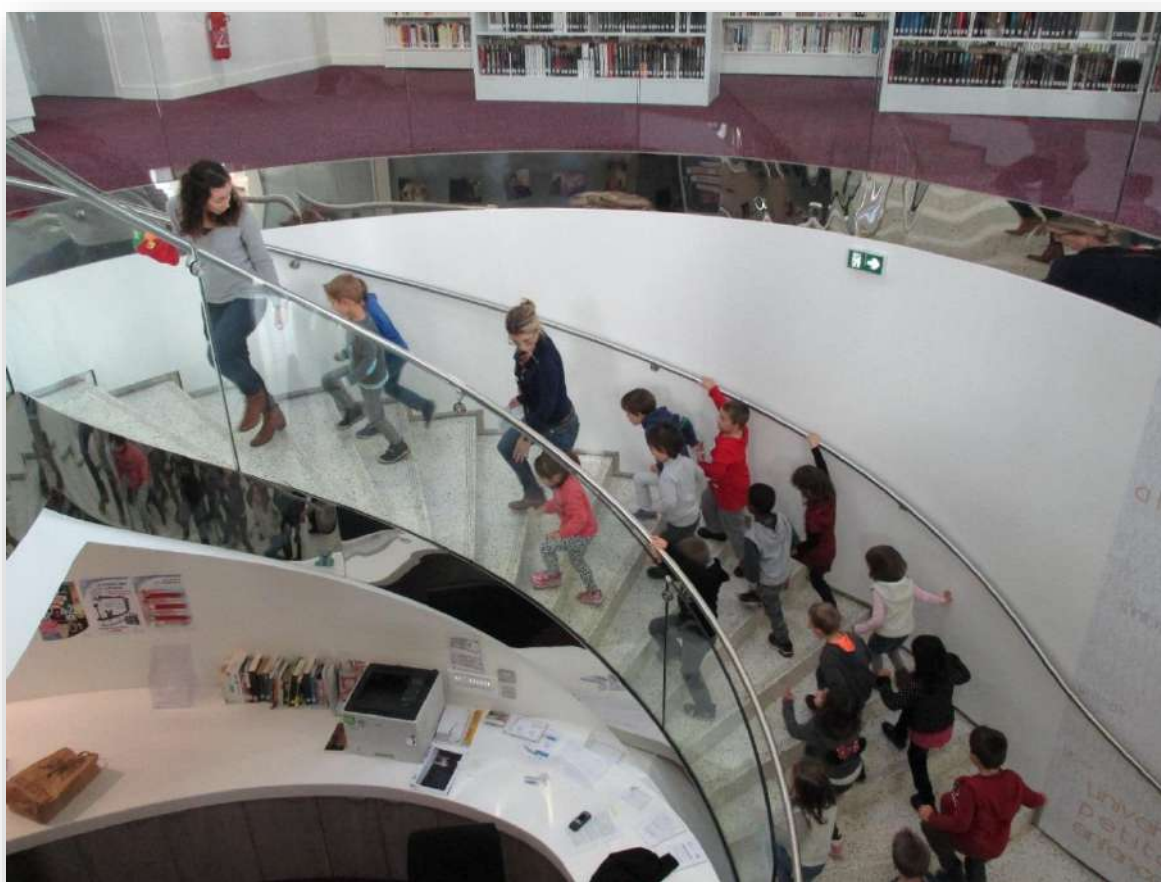
Promenade à la médiathèque

Nombre et durée des séances : 1 à 3 séances, 45 min