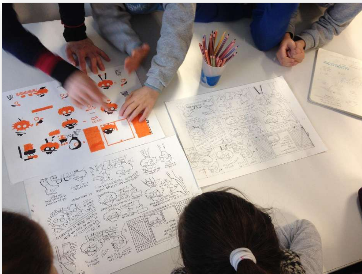
Atelier avec l'auteur de BD Marie Novion

Nombre et durée des séances : 3 séances, 45 min