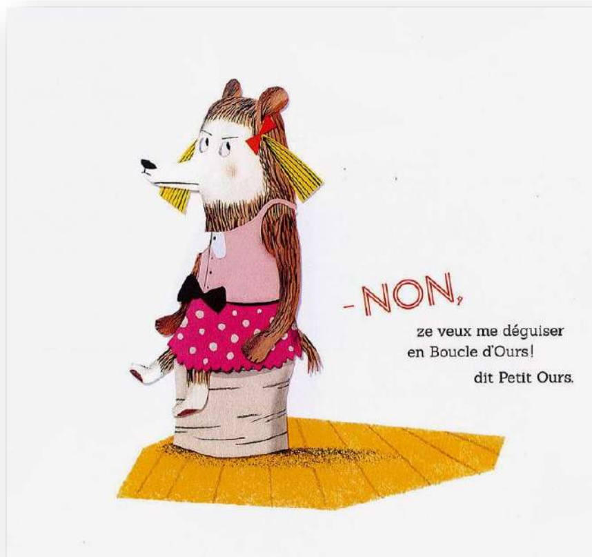
Boucle d'ours de Stéphane Servant et Laetitia Le Saux © Editions Didier Jeunesse

Nombre et durée des séances : 1 à 2 séances, 45 min